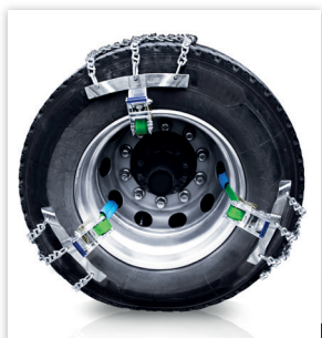
Dispositif de dégagement

La SNOWCRAMP XXL® est fonctionnelle sur tous types de terrains .