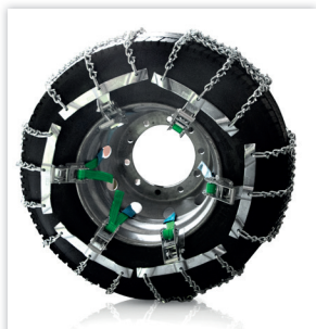
*Dispositif antidérapant amovible