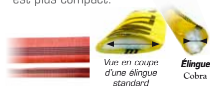
Vue en coupe d'une élingue standard