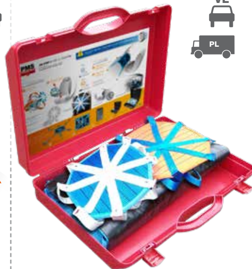
Le kit complet incluant les 3 éléments :

Ref. ABSTOP CO TO • Ref. ABSTOP CO PL Ref. ABSTOP CO PA