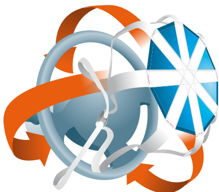
Élément à installer sur l'airbag du volant.