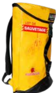
Sac fermé prêt à l'emploi. Avec poignée et sangles type sac à dos pour un transport facile sur intervention.