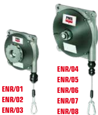
ENR/01 ENR/02 ENR/03