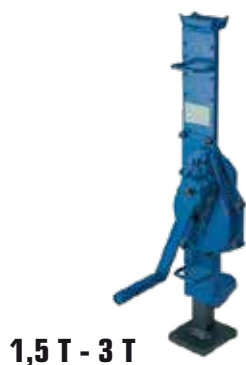
1,5 T - 3 T