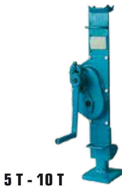
5 T - 10 T